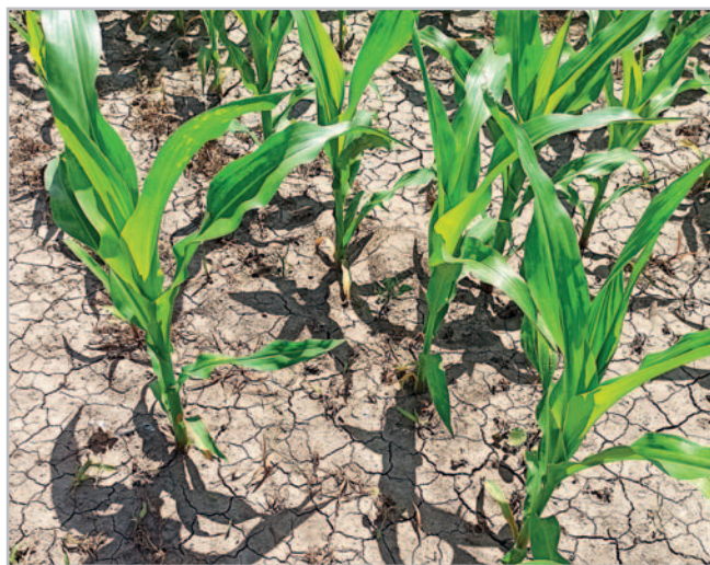
Tudor 114 OD – jedinečný třísloužkový herbicid do kukuřice

vin a tím brzdí vývoj a růst plevelů. Spektrum plevelů je velmi široké, od dvouděložných až po ježatku kuří nohu. Použití je postemergentní (BBCH 12–18) v dávce 0,5 l/ha. Přípravek je přijímán především listy, ale i kořeny a rychle se v rostlině přemísťuje. První projevy jeho účinkování mohou nastat již po 4–5 dnech od ošetření. Zasažené plevely zcela odumírají 6–8 týdnů po ošetření. Aplikace by měla proběhnout při teplotě 10 až 25 °C, aby se zajistila nejlepší účinnost. Pro doplnění reziduálního účinku lze využít i jeho tank-mix s přípravkem Osorno s účinnou látkou mesotrion (100 g/l), dávkování 0,5 l/ha Tudor 114 OD a 1 l/ha Osorno.